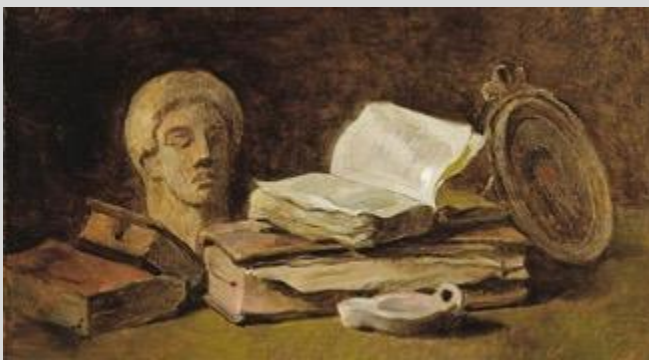
OUTILS ET MÉTHODOLOGIE