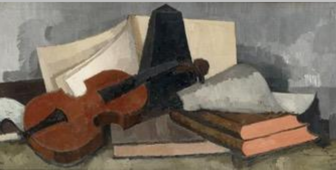
OUTILS ET MÉTHODOLOGIE