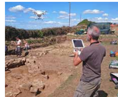
Castrum Novum, Italie.